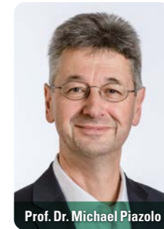
Prof. Dr. Michael Piazzolo